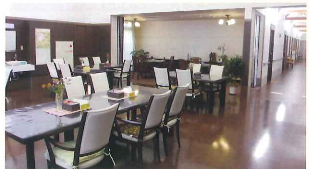
※写真はシルバーホームみなみながの